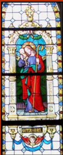
Unser Kirchenfenster „Der Gute Hirte“ vom Jahre 1868

Alle TeilnehmerInnen waren von den Arbeiten sehr beeindruckt. Ende November werden die restaurierten Fenster wieder eingebaut. Die restlichen Fenster wollen wir nächstes Jahr –wenn die finanziellen Mittel reichen oder wir Sponsoren finden- restaurieren lassen. Die Restaurierung eines Fensters kostet durchschnittlich €3000,-.