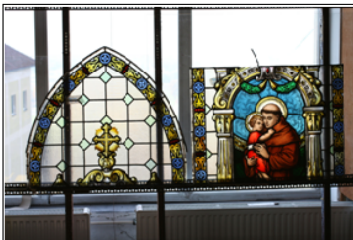
Unser Kirchenfenster „Der Hl. Antonius“ vom Jahre 1868

Der Finanzausschuss sagt allen die in diesem Jahr einen Beitrag für die Kirche oder die Pfarre geleistet haben, ein herzliches Vergelt's Gott und bittet auch im nächsten Jahr um Unterstützung.